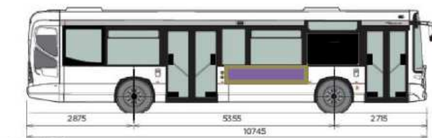
GX 137 L Cadre Flanc Droit : 211 cm x 38 cm