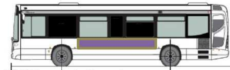
GX 137 L Cadre Flanc Gauche : 274 cm x 38 cm