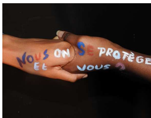
Visuel pour l'affiche