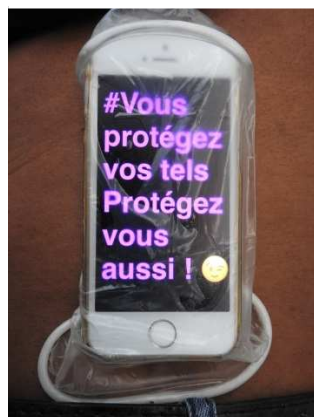
Un visuel pour le préservatif féminin

Voici les visuels gagnants du concours disponibles sur les préservatifs ainsi que le visuel gagnant pour l'affiche :