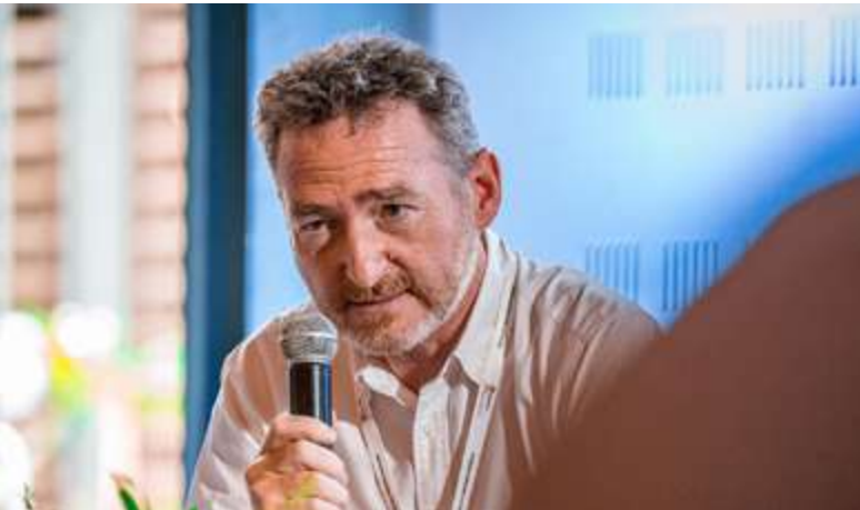
Yann LE BRIS , Procureur de la République, Mayotte