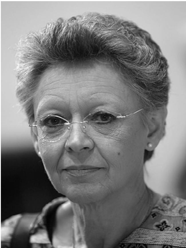
Pr. Françoise Barré-Sinoussi

«Je remercie les organisateurs, notamment le directeur de Nariké M'sada, de m'avoir invitée à m'exprimer lors de l'ouverture de ce colloque.